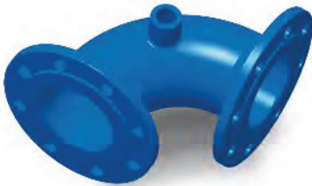
Q-Stück mit Nabe Flanschbogen mit Nabe Double flanged elbow with boss