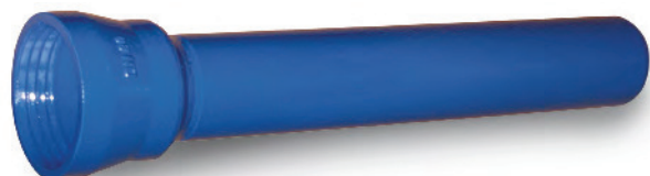
Muffenpassrohr Muffenpassrohr mit Schraubmuffe Socket pipe fitting with threaded socket