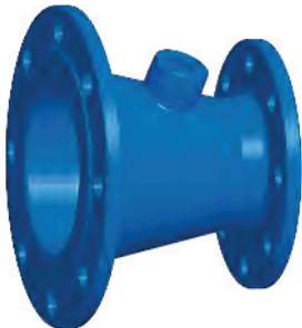
FFR-Stück mit Nabe Flanschreduzierstück mit Nabe Double flanged reducer with boss