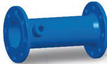
FF-Stück mit Nabe Zweiflanschstück mit Nabe Double flanged pipe with boss