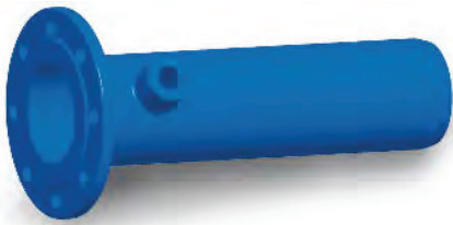
F-Stück mit Nabe Einflanschstück mit Nabe Flange spigot pipe with boss

Wir haben die Lösungen für Ihre täglichen Anwendungsfälle. Sprechen Sie uns an! We have the solutions for your everyday applications. Contact us!