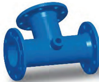
T-Stück mit Nabe Flanschen T-Stück mit Nabe All-flanged-tee with boss